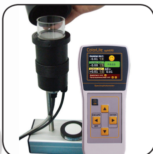
Messaufbau inhomogene Proben

Das sph870 ist ein benutzerfreundliches, tragbares Spektralphotometer mit 45^\circ/0^\circ Geometrie, welches sich aufgrund des umfangreichen Zubehörs für eine Vielzahl von Oberflächen und Materialien eignet. So lässt sich das Gerät zum Beispiel mit nur wenigen Handgriffen von einer 45^\circ/0^\circ zu einer d/0^\circ Geometrie umbauen. Die hochauflösende Technologie ermöglicht dabei eine spektrale Abtastung in 3,5nm-Schritten bei einer Messzeit von gerade einmal 0,5 Sekunden. Die Menüführung ist einfach und übersichtlich gehalten, so dass auch ungeübte Mitarbeiter den Messvorgang schnell und fehlerfrei durchführen können.