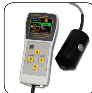
sph860 mit Ulbricht- Kugel d/8^\circ Messkopf