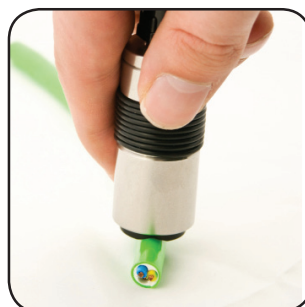
Prismamesskopf für zylindrische Proben